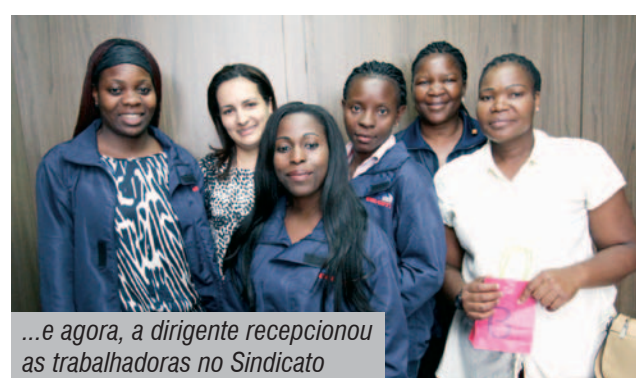
...e agora, a dirigente recepcionou as trabalhadoras no Sindicato