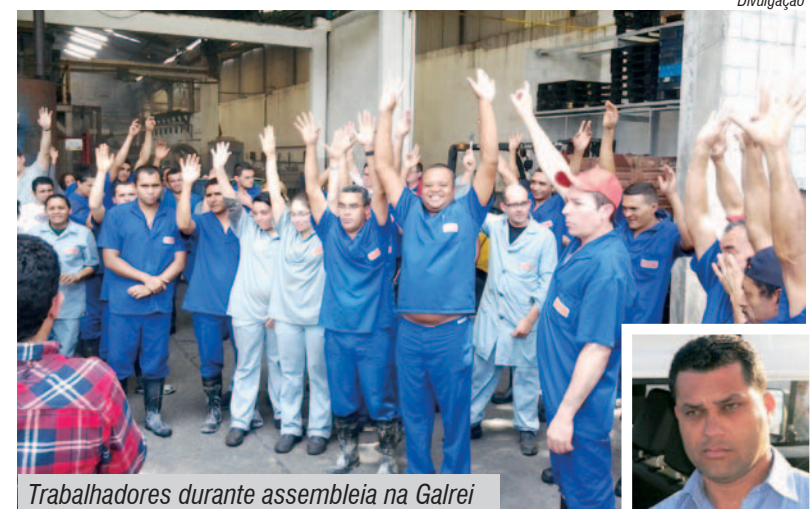
Trabalhadores durante assembleia na Galrei

Após uma rejeição, trabalhadores na Galrei, em Diadema, aprovaram as propostas de Participação nos Lucros e Resultados e vale-alimentação negociadas pelo Sindicato.