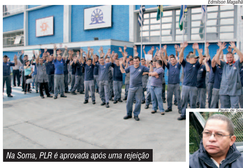
Na Soma, PLR é aprovada após uma rejeição

"E com a mobilização da companheirada conseguimos garantir mais esta vitória", finalizou.