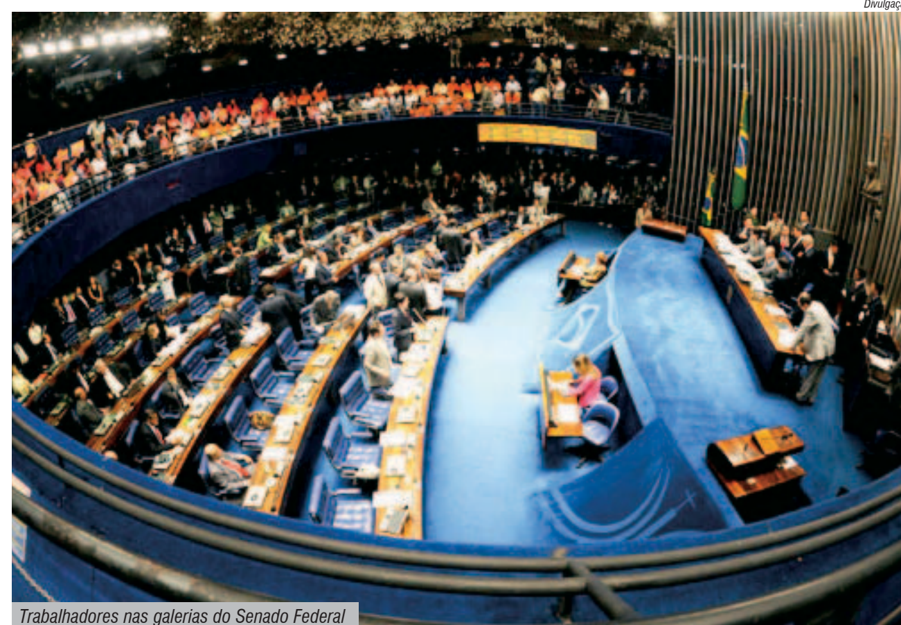
Trabalhadores nas galerias do Senado Federal

muitos dos parlamentares da atual legislatura mais empenhados em defender os trabalhadores tiveram dificuldades em obter votos