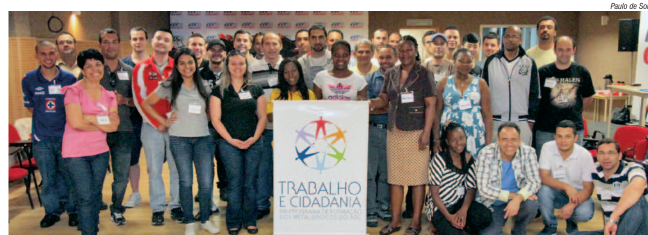
Trabalhadoras de Moçambique vão ao Trabalho e Cidadania