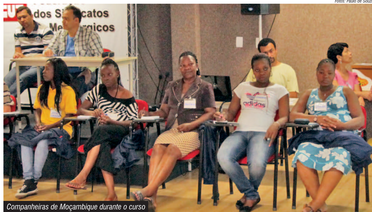
Companheiras de Moçambique durante o curso

As companheiras também participaram do encerramento do Curso de Cultura Afro-brasileira e Africana, na última segunda-feira.